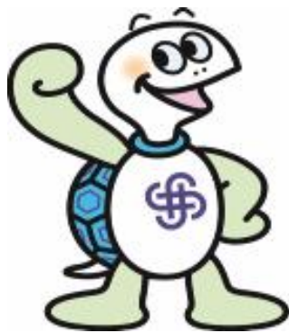
神奈川区マスコットキャラクター「かめ太郎」