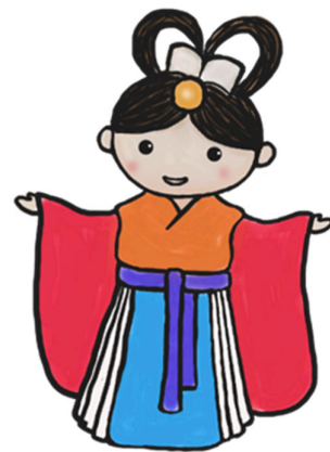
神奈川図書館マスコットキャラクター「乙姫カナ」