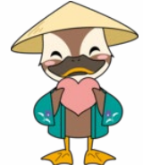
ほどがやく こうしき 保土ヶ谷区公式マスコット ほどぴー