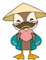
保土ヶ谷区公式マスコット ほどびー