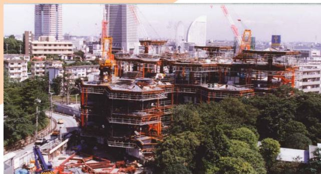
【写真】上：現在の中央図書館 下：建築中の中央図書館

横浜市中央図書館は、平成 6 年 2 月 22 日に一部開館いたしました。そして 4 月の中央図書館の全面開館にあわせて、図書館情報システムが完成し、市立図書館全館がネットワークでつながりました。このことにより、あたかもひとつの図書館のように、利用者用検索機で市立図書館全館の本を調べることができるようになり、共通の図書館カードでどの市立図書館でも本を借りられ、どの市立図書館でも返せるようになりました。