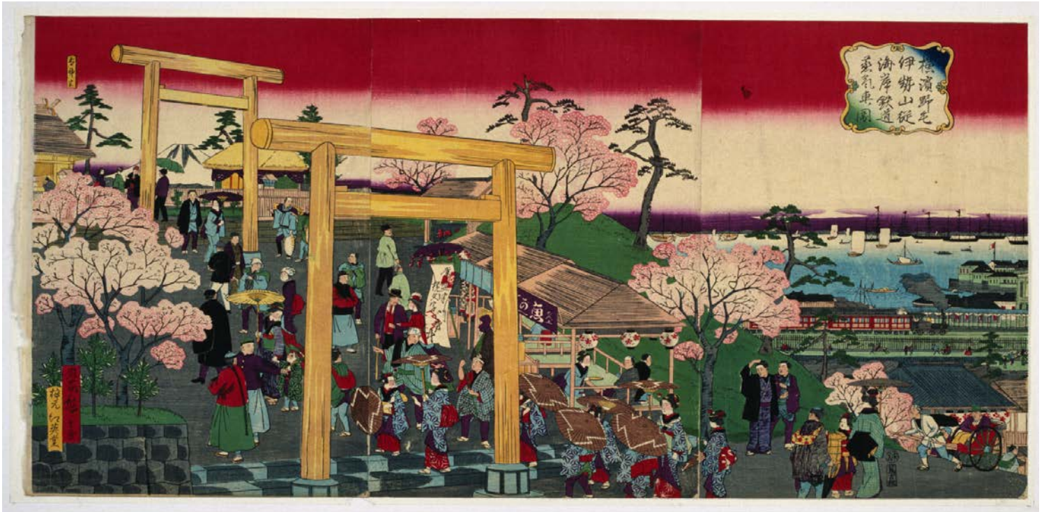
市立図書館ホームページ「Yokohama's Memory」より 【横浜野毛伊勢山從海岸鉄道蒸気車ノ図】

ホームページで「Yokohama's Memory」で取り上げた浮世絵の紹介を開始 ※横浜市立図書館が都市横浜の記憶装置として所蔵資料のPRを目的に展開している事業。「①ホームページでの公開」「②絵葉書の発行」「③展示会の開催」の3つのメニューからなる