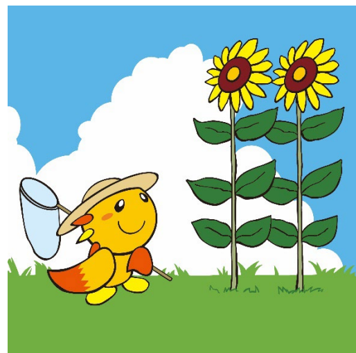
旭区マスコットキャラクター あさひくん