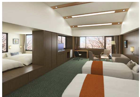
② 客室（エグゼクティブルーム）