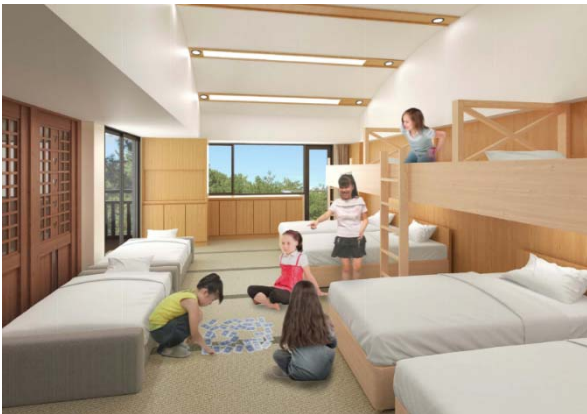
① 客室（スタンダードルーム）