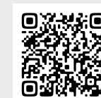
各区の 防災マップ

昭和24年に現存する世界最古の木造建造物である法隆寺(奈良県斑鳩町)の金堂が炎上し、壁画が焼損したことから、毎年1月26日は「文化財防火デー」と定められています。横浜市でも指定等を受けた文化財を対象とした消防訓練等を、年間約20件実施しています。