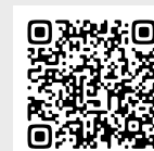
浸水ハザード マップ