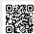
わいわい 防災マップ