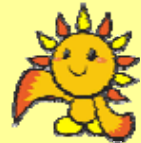
旭区のキャラクター あさひくん