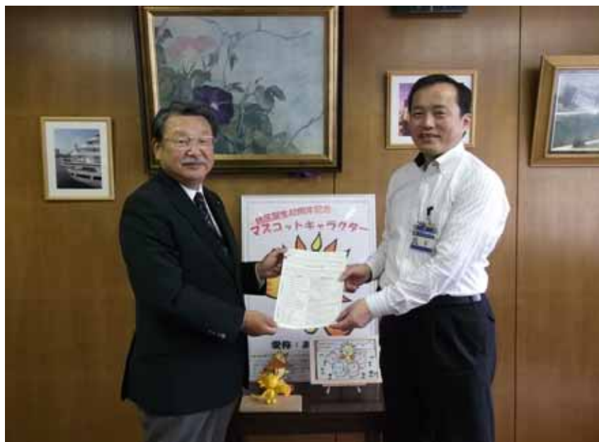
林委員長（左）と濱旭区長（右）

なお、7月27日（金）に、 検討委員会事務局から旭警察署 に同要望書を提出いたしました。