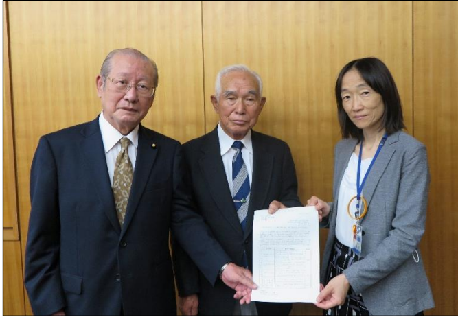
左から中山副会長、北井部会長、深川区長