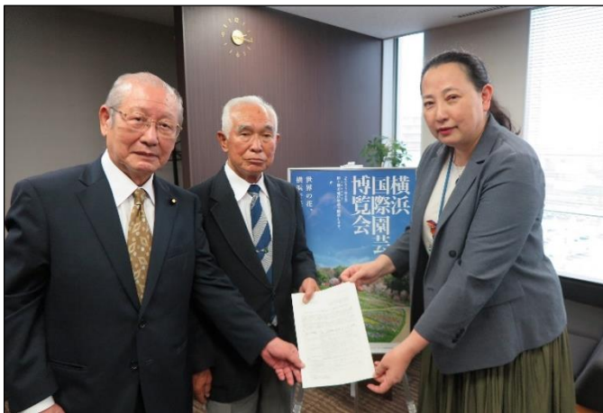
左から中山副部会長、北井部会長、植木区長