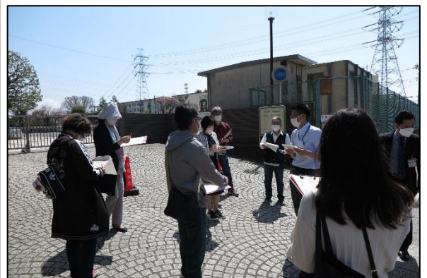
<通学安全点検の様子>