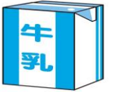
牛乳 1本 約134kcal

間食は菓子類に偏らず、野菜や果物・乳製品といったビタミン類や ミネラルなど不足しがちな栄養素を補うことができる食品をとりいれ ましょう。