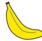
バナナ 1本 約86kcal