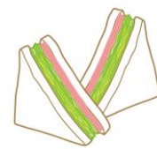
ハンカサド 1包 約265kcal