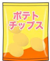
ポテトチップス 1袋 約500kcal