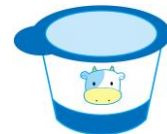
ヨーグルト 1個 約67kcal