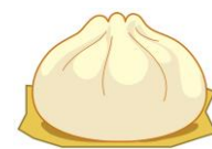
肉まん 1個 約279kcal