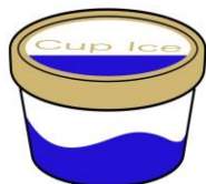
アイスcream 1個 約235kcal