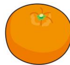
みかん 1個 約34kcal