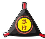
おにぎり 1個 約180kcal