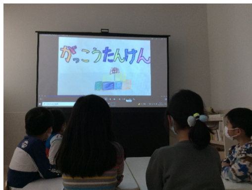
動画を介した子ども間の交流の様子