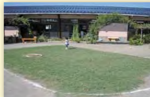
保育園や幼稚園の園庭の芝生化（青葉区）

更に芝生化を拡大するために、維持管理に必要な地域による協力体制について、そこに携わる人づくりやネットワークづくり、区役所等と連携した推進が必要です。