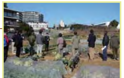
農業の取組の推進について 取組例：市民農園コーディネーター研修