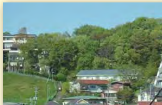
樹林地の保全：上星川地区（保土ヶ谷区）

指定、買取ともに概ね目標は達成していることは評価できますが、みどり税を計画期間内に最大限有効活用した事業推進についても検討する必要があります。