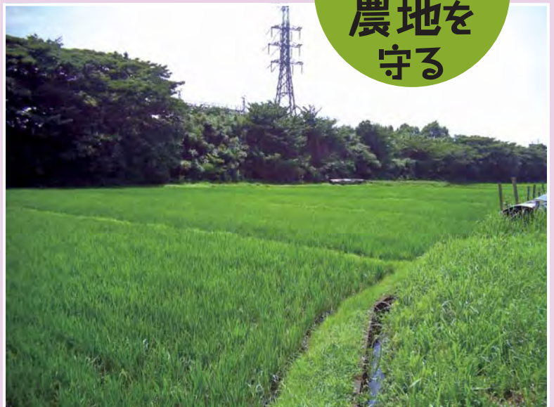
▲ 初夏の水田（瀬谷区）