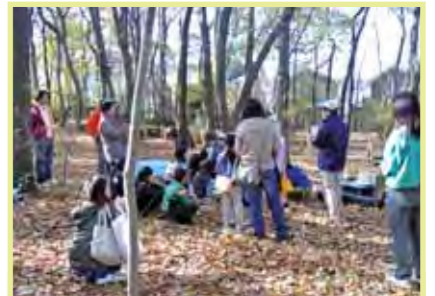
樹林地の維持管理と利活用について 取組例：森の中のプレイパーク事業