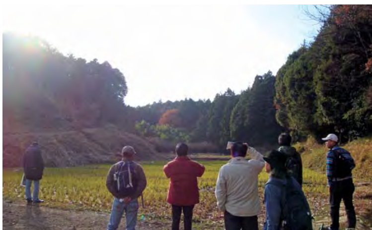
現地調査（新治市民の森）