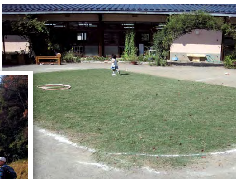
保育園や幼稚園の園庭の芝生化（青葉区）