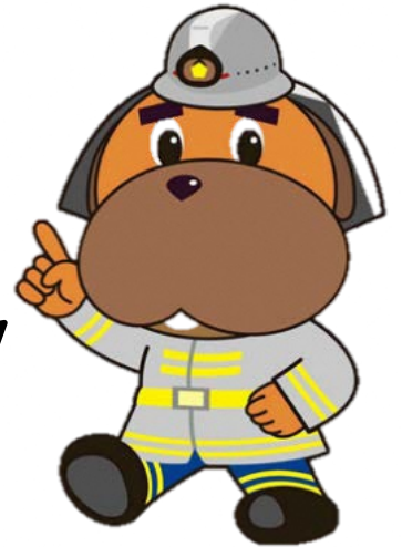
横浜消防マスコット 「ハマくん」