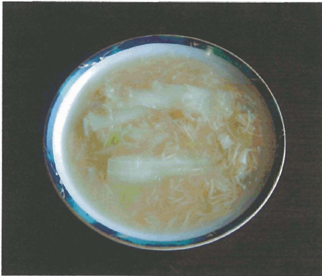
白菜と干し貝柱の煮込み