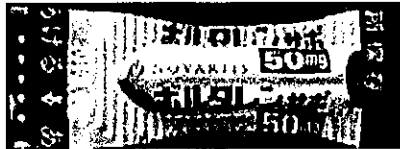
正常品のアルミシート

患者様ならびに医療従事者の皆様には多大なご心配をおかけしますことを、心より深くお詫びいたします。