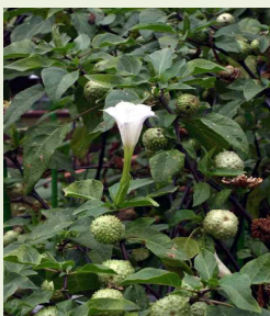
チョウセン アサガオの 葉と花