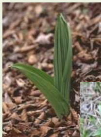
芽出し期 のバイケイ ソウ