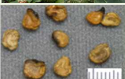
チョウセン アサガオの 種