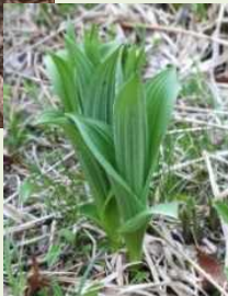
芽出し期 のコバイ ケイソウ