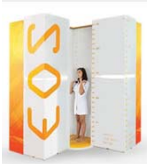
据置型デジタル式汎用X線診断装置 「sterEOSイメージングシステム」

医師会・教育委員会と連携した脊柱側弯症検診体制構築の一環として、放射線量が低く、立位撮影が可能な 汎用X線診断装置 を国内で3番目に導入しました。