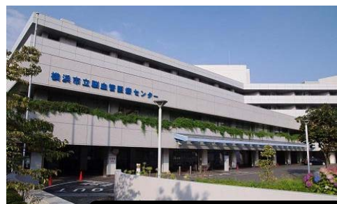
脳卒中・神経脊椎センター