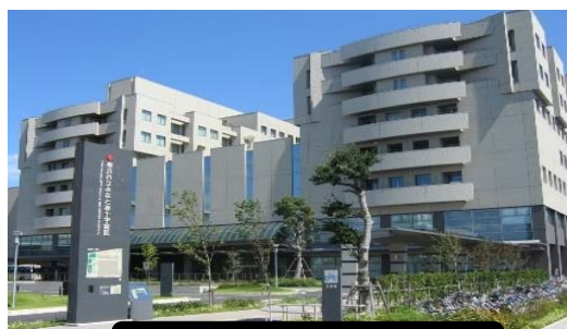
みなと赤十字病院