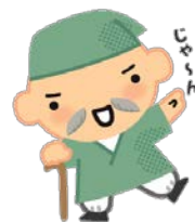
マスコット キャラクター 健康ほうし君