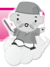
イメージキャラクター 健康ほうし君

65歳以上の方が、介護施設等でボランティア活動を行うと、ポイントがたまり、寄付または換金できる仕組みです。