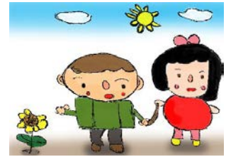
松風学園マスコットキャラクター