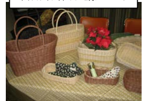
利用者作品(籐かご)