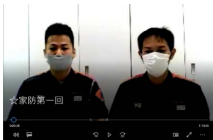
オンライン家庭防災員研修の様子

南消防署は、今後も様々な視点から、よりよいサービスが提供できるよう新たな取り組みに挑戦していきます!