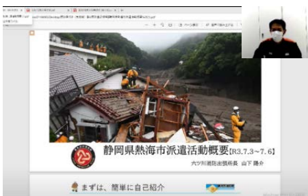
写真やデータを画面に映しながら実施しました