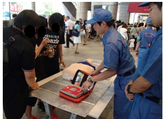
【地域イベントでの応急救護指導】