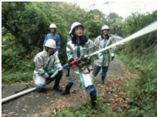
【地域での放水訓練】