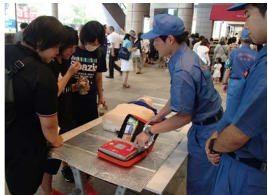
【地域イベントでの応急救護指導】