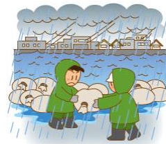
すごく つよ あめ 強い 雨