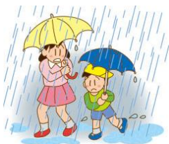
すこし つよ あめ 強い 雨