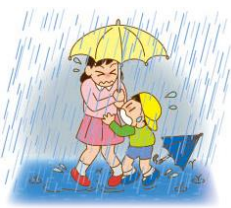
つよ あめ 強い 雨