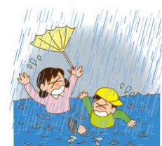
いちばん つよ あめ 強い 雨