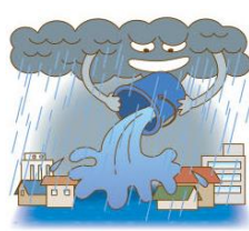
とても つよ あめ 強い 雨