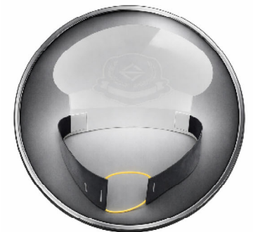
できあ 出来上がりイメージ