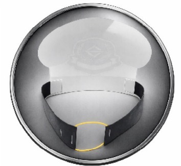
できあ 出来上がりイメージ