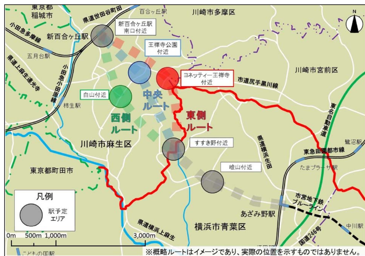
図 概略ルート・駅位置案