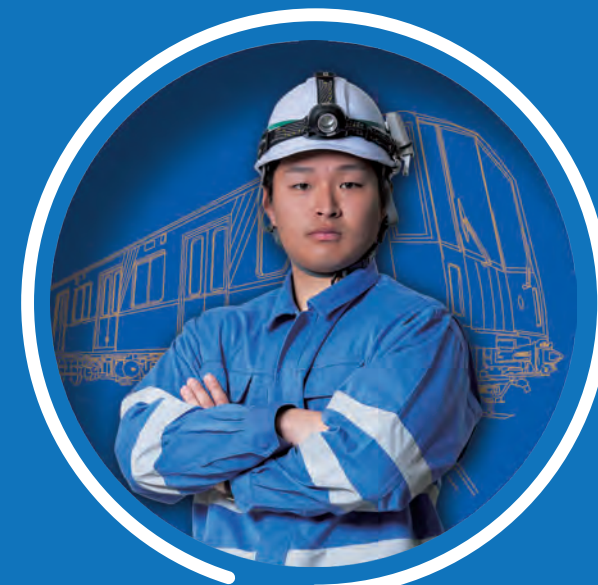
地下鉄保守技術員

1日約61万人のみならずが利用される、市営地下鉄の安全・快適を支える存在。各駅の駅務員として窓口・改札での案内業務、ホームでの整理・監視や体の不自由なお客様の補助、売上管理などの事務作業を担当します。駅務員として一定期間勤務した後は、「運転士養成課程」を経て地下鉄運転士を目指すことも可能です。