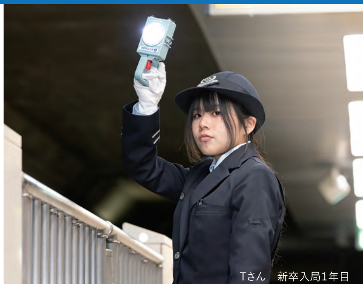
Tさん 新卒入局1年目