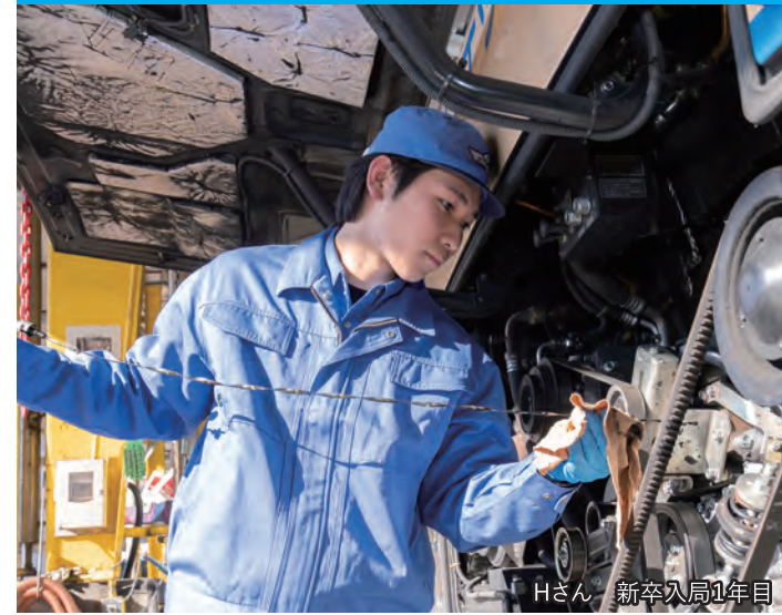
Hさん 新卒入局1年目