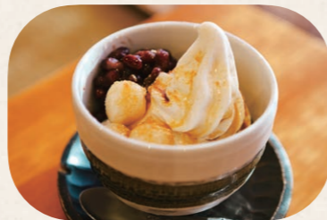
名物の「手まりパフェ(黒蜜きな粉白玉)」(580円・税込)は宿場町の甘味をイメージ。手まりのような丸餅が愛らしい和風のパフェで、入浴後のほった体にぴったり

サウナ愛好家や仕事帰りの方など、幅広い方に満足いただける施設を目指しています。「また来るね」と声をかけてくださるお客さまの存在が喜びです。