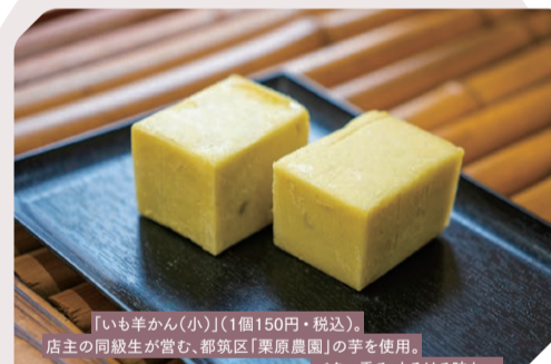
「いも羊かん(小)」(1個150円+税込)。店主の同級生が営む、都筑区「東原農園」の手による。バター香る、とろける味わい

和菓子屋を営んでいた両親の家を改装して開業しました。季節によって変わる和菓子、味だけでなく目でも楽しんでほしいです。