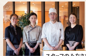
スタッフのみなさま