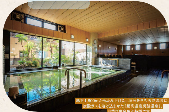
地下1,800mから汲み上げた、塩分を含む天然温泉に、炭酸ガスを溶け込ませた「超高温炭酸温泉」。自然な黄金色が特徴です。