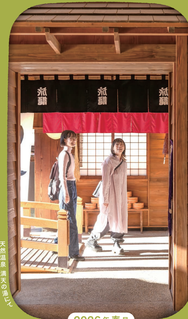
天然温泉 満天の湯にて