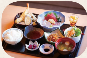
「数量限定 湯もみの里御膳」(2,540円・税込)。魚屋が選んだ旬の鮮魚はもちろん、かつおと鯖の出汁が香る自家製つゆをつけていただく天ぷらも絶品。ほか「かつ丼」も人気

疲れたときは、ぜひ当店で一日ゆっくり過ごして休んでください。お帰りになってからも体がポカポカして、よく眠れるという声もありますよ!