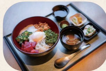
栄養がある食材をふんだんに使用した「健康増進井御膳」(1,500円・税込)。食事処では一からレシピを考案した、健康に良いメニューを提供

意識しなくても疲れやストレスは溜まってしまうので、ここで解消してほしい。日常のご褒美として癒やしを提供できたらうれしいです。