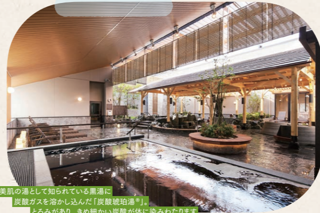
美肌の湯として知られている黒湯に炭酸ガスを溶かし込んだ「炭酸琥珀湯」。とろみがあり、きめ細かい炭酸が体に染みわたります