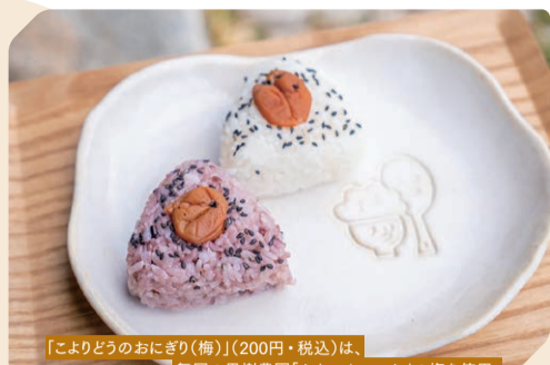
「こよりどうのおにぎり(梅)」(200円+税込)は、舞岡の果樹農園「かねこふあ〜む」の梅を使用。優しく元気になる味です

「ぐるっとを見た」と言ってくださったお客さまに、「ケーキドリンクセット」50円割引 *カフェタイムのみ 期限：2026年6月30日(火)まで