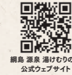
網島 源泉 湯けむりの庄 公式ウェブサイト

営業時間：9:00～24:00 (最終受付 23:00) 【食事処】10:00～23:30 (L.O. 23:00) (揚げ物・焼き物L.O. 22:45) 【岩盤浴】9:00～23:00 入館料：平日 大人 1,540円・税込 子ども 1,180円・税込 土日祝 大人 1,700円・税込 子ども 1,320円・税込 *大人土日祝料金には、別途入湯税100円が必要 *大人料金は中学生以上。入館は小学生以上 【岩盤浴】平日 880円・税込 土日祝 990円・税込 *ご利用は中学生以上 定休日：なし *年に数日間ほど休館日あり。公式ウェブサイトをご覧ください アクセス：ブルーライン 新横浜駅から市営バス13系統「梅野谷」下車徒歩約1分 お問合せ：☎045-545-4126