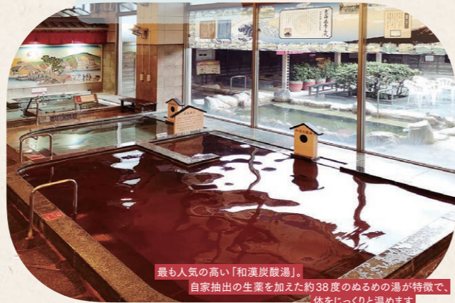
最も人気の高い「和漢炭酸湯」。自家抽出の生薬を加えた約38度のぬるめの湯が特徴で、体をじっくりと温めます

おひとりでも、お子さま連れでも歓迎。 「毎日行きたくなるおふる屋さん」を目指して