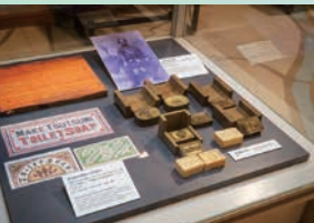
横浜が初めてとされるものごとについて解説する展示も多数。写真は、初の国産石けんのラベルや金型の展示

江戸時代から昭和初期までの横浜を知る資料を27万点も収蔵。中庭に植わる「たまくすの木」は、ペリー上陸や日米和親条約締結を見守ったタブノキの子孫にあたるもの。訪れた人に憩いを与えています。