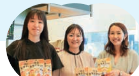
ミツハシライス 新事業推進課のみなさん

さまざまなかたちでお米を楽しんで いただくため、米粉を使ったお菓子 を考案。子どもから大人まで誰でも 食べられるように、28品目アレルギー フリーにしました。