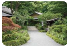
小谷戸の里、入口の様子

舞岡公園の事務所があり、イベントなどが多く開かれるエリア。古民家、広場、作業棟などがあり、季節ごとの行事のほか、竹細工やわら細工などのワークショップが開催されます。広場では、けん玉や竹とんぼなどの音あそびも体験できます。 ※古民家は、茅葺屋根の修理工事のため、10月初めから2023年3月末まで見学できません 開催時間：9:00～17:00 定休日：第1・第3月曜（祝日の場合は翌日）