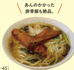
あんなにかかった排骨飯も絶品!

所在地: 中区山下町190 営業時間: 平日 11:30~15:00, 17:00~21:30 (LO 20:45) 土日祝 11:30~21:30 (LO 20:45) (水曜定休) お問合せ: ☎045-681-2321