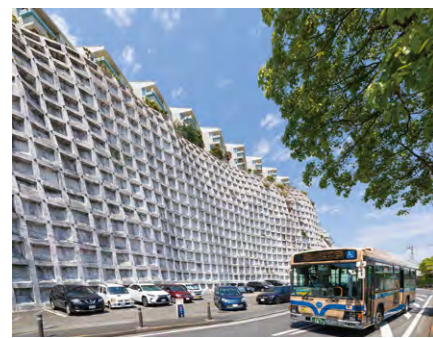
市営バス「本牧車庫前」駅周辺

新羽乗務管理所には約60人の運転士がいて、和気あいあいとした家族のような雰囲気です。市営地下鉄は、地元の方が愛着を持って使ってくださっていて嬉しいです。これからも、安全・確実・快適な交通サービスを心がけます!