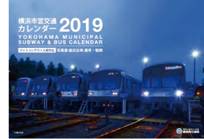
市営交通カレンダー2019表紙

毎年ご好評いただいている「市営交通カレンダー」の2020年版の製作にあたり、皆様から市営バス・市営地下鉄の写真を募集します。2020年を彩る1枚をぜひご応募ください！