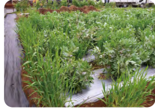
小麦やじゃがいもなどが育つ畑

下飯田駅を降りてすぐ、パン屋さんとして隣り合うお店。社会福祉法人が運営するお店で、知的障害をもつスタッフも元気に働いています。敷地内の温室・畑では、小麦や野菜を無農薬で栽培。ここで採れる小麦がお店で出すパン・ピザに使われています。生産から販売まで一手に担う、県内有数のパン屋さん。朝採り野菜をふんだんにトッピングした人気メニューの「きまぐれオルトラナピッツァ」は、トマトソースをベースに素材の味を楽しめるボリューム満点の美味しさです。