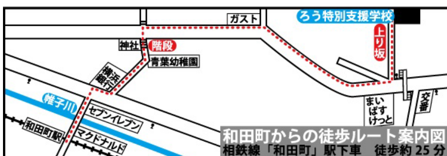
和田町からの徒歩ルート案内図 相鉄線「和田町」駅下車 徒歩約25分