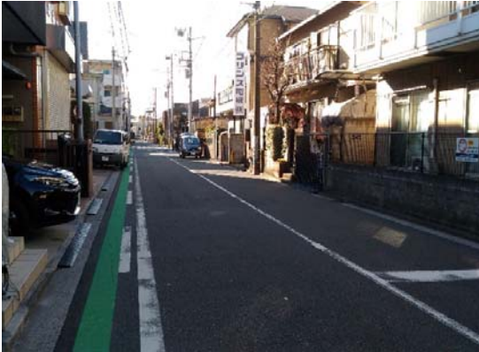
①市場小学校北西側交差点からスカイコート鶴見2東側四叉路までの直線道路