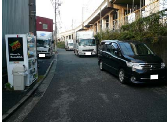
⑦横須賀線沿いの道路