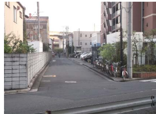
⑨ダイアパレスⅢ沿いの道路