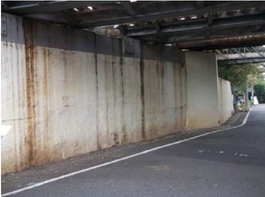
⑥横須賀線ガード下