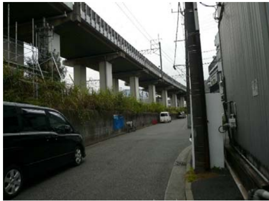
⑧横須賀線沿いの緑地