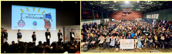
←昨年度の 表彰式の様子