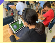
←作成された学習動画を一人ひとりが 選んで見ることができます