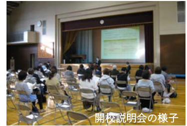
開校説明会の様子

緑園学園の開校まで4か月となりました。準備が進む中で、地域・保護者の皆様にご協力をお願いしたいことについて、お知らせいたします。