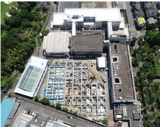
第2工区工事令和3年5月時点