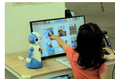
AIによるおすすめ絵本の紹介

管理運営の効率化と利用者サービスの向上につながる仕組みの導入 (例) ICタグによる蔵書管理、 自動貸出し・返却の実施、 案内業務へのロボット活用検討 等