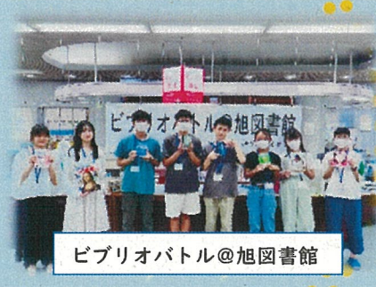
ビブリオバトル@旭図書館

司書のおすすめする本を紹介するブックトーク(港南、港北、中、緑)、紙芝居(港北、栄、鶴見)など。