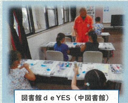
図書館 de YES (中図書館)

イベントの内容は館により異なります。取材を希望される場合は各図書館にお問い合わせください。