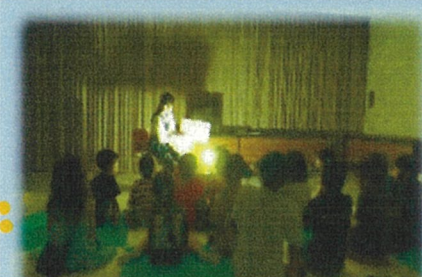
夏の夜のこわいおはなしの会 (南図書館)

図書館の仕事体験やバックヤードツアー、ワークショップなど全館で体験型のイベントを実施します。