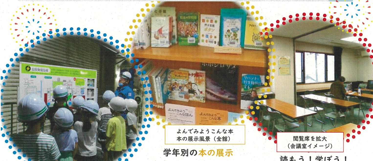
図書館で水博士になろう！ （戸塚図書館）