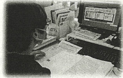
職員がeラーニングを視聴する様子

令和2年度は小学校、令和3年度は中学校において新学習指導要領の全面実施、令和4年度からは高等学校において年次進行での実施となります。各学校は、新学習指導要領の趣旨を踏まえて本市が策定した「横浜市立学校 カリキュラム・マネジメント要領」（以下「カリ・マネ要領」）を拠り所に、eラーニングを活用し、児童生徒に育成を目指す資質・能力を育てています。