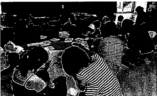
戸塚図書館「0歳からの絵本に親しむ講座」