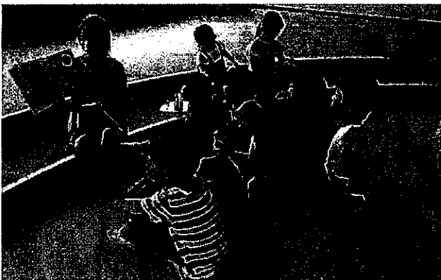
緑園東小学校「図書委員による読み聞かせ」