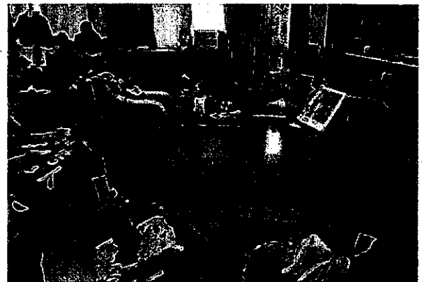
若葉台特別支援学校「知的障害教育部門の生徒から 肢体不自由教育部門の児童生徒に向けた読み聞かせ」