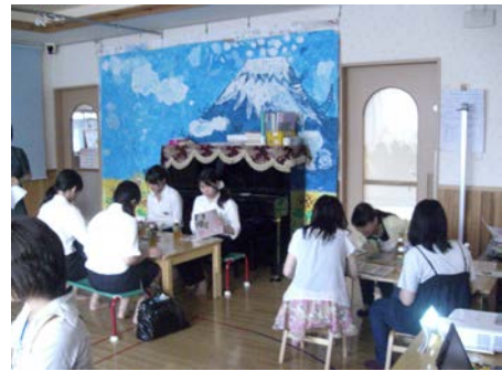
<保育所見学会の様子>

保育士養成施設の学生等を対象に市内保育施設の現場を知ってもらう機会として、保育所見学会を実施します。