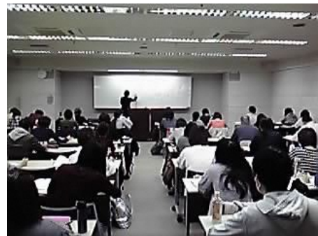
<保育士試験直前対策講座の様子>

また、新たに保育関係団体が独自で行う人材確保に関する取組への補助や、保育士資格の取得を目指す市内保育施設従事者に対して、養成校受講料等の補助を実施します。