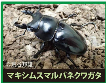
マキシムスマルバネクワガタ