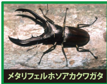
メタリフェルホンアカクワガタ

野外に出ると、日本のカブトムシやクワガタの餌やすみかをうばったり、交雑したり、昆虫の病気を広めたりします。