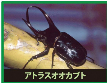
アトラスオオカブト