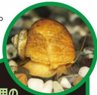
かんしょう用の ゴールデンアップルスネール

つかまえても、他の場所に持って行かないでね。飼っている貝は、池や川に放さないでね。