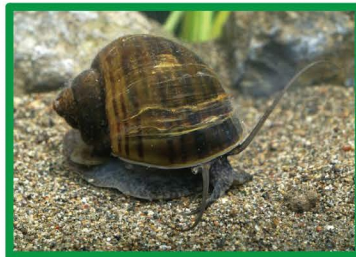
スクミリンゴガイ