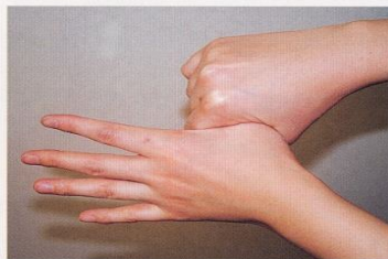
5. 親指と手掌をねじり洗いする