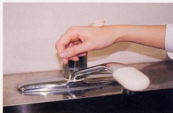
7. 水道の栓を止めるときは、手首か肘で止める。できないときは、ペーパータオルを使用して止める