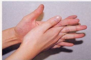
4. 指の間を十分に洗う