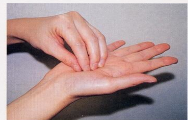
3. 指先、爪の間をよく洗う