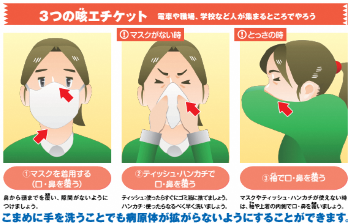
図3 咳エチケットについて