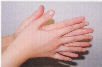
1. 手のひらを合わせ、よく洗う