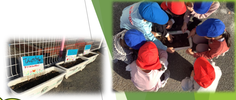
協力して育てる栽培活動