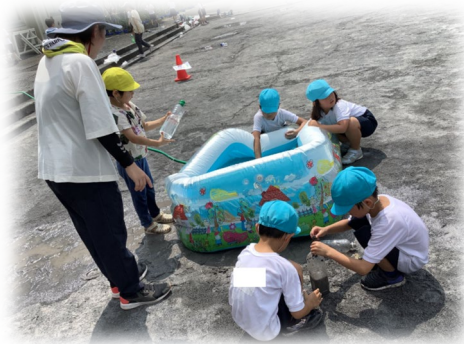
生活科などの学習を通じた交流