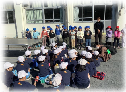
遊びを通じた出会い

峯岡幼稚園 保土ケ谷保育園 りとるルーナ GENKIDS星川保育園 ラフ・クルー星川保育園