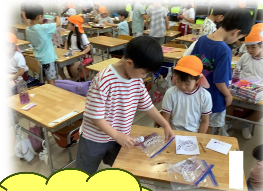
高学年児童による小学校体験