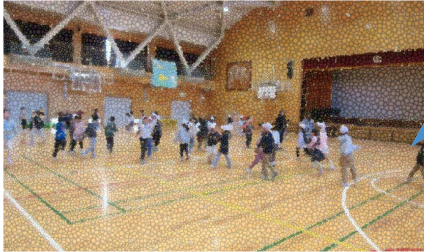
集団活動を通じた交流（体育館）

園児たちはどの子も楽しそうに過ごしていました。園児や児童、それぞれの様子を共有することができました。