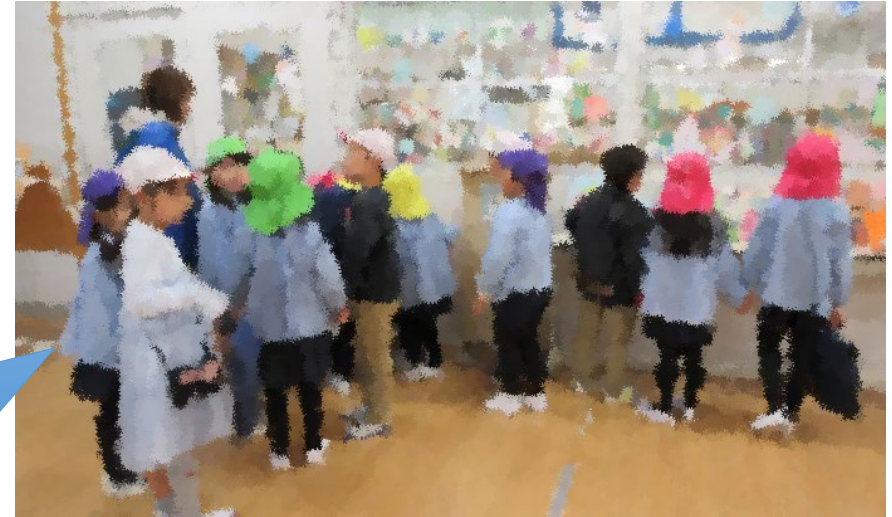
学校探検・施設見学を通じた交流

1年生は、お兄さんお姉さんになり、一生懸命案内していました。とても楽しかったそうです。