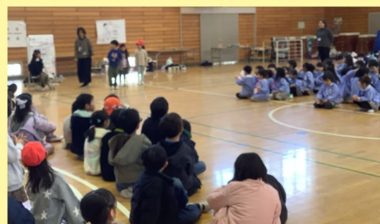
1月29日 東幼稚園、1月30日にじいろ保育園、鴨居保育園、2月2日、黒滝幼稚園、さくらの郷みらい保育園、そよかぜ保育園の年長さんと交流しました。子どもたちと一緒に考えて会を企画しました。ジャンケン列車や輪投げや射的などの手作りおもちゃなどで楽しく過ごしました。手つなぎ鬼遊びでは、年長さんとペアになり、相手を気遣いながら遊びました。