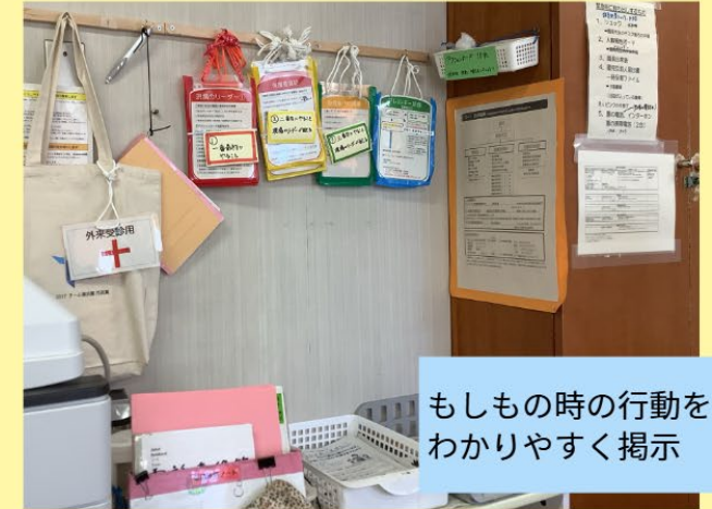
もしもの時の行動をわかりやすく掲示