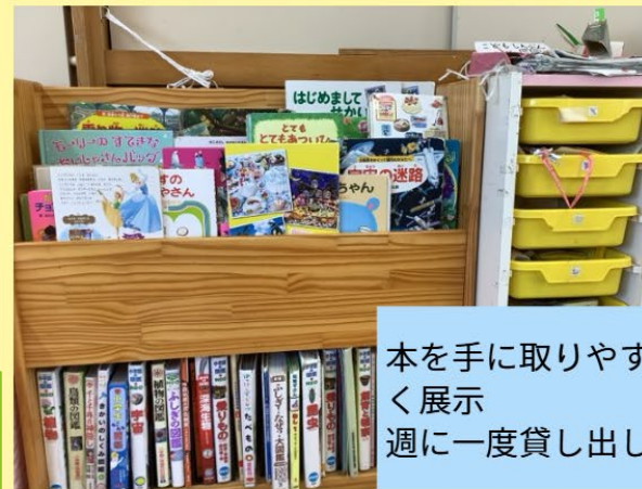
本を手に取りやすく展示 週に一度貸し出し