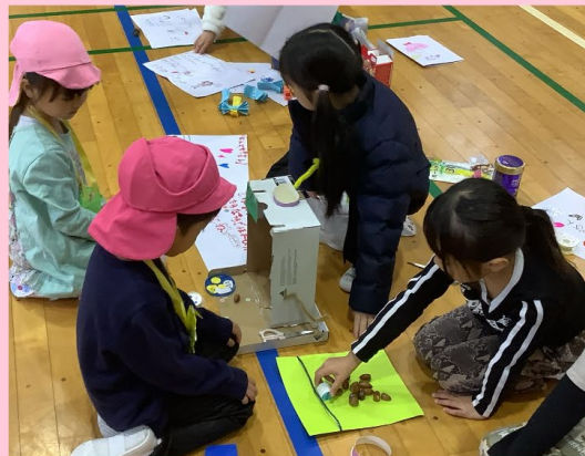
11月25日 スターチャイルド鴨居ナーサリー、太陽の子鴨居駅前保育園、鴨居子ども園の年長さんと交流しました。秋のどんぐりを使った手作りおもちゃで一緒に遊びました。手作りのおもちゃの制作過程では、年長さんに喜んでもらえるように、事前に改良を重ねている姿がたくさん見られました。説明の仕方を工夫したり、勧誘の声かけを積極的にしていました。

※子ども達の楽しんでいる姿がたくさん見られた。園児を楽しませるために考えることが1年生の学びにつながっていることが確かめられた。学びの芽になるようなことを園と小学校と情報共有していくことが大切であることがわかった。