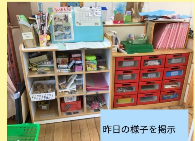
昨日の様子を掲示