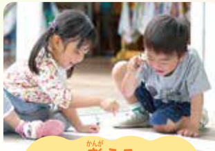
考える 試す・工夫する