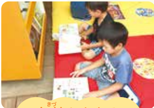
気付く・わかる やってみようとする