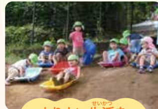
よりよい生活を 送ろうとする

乳児期(生まれてから1歳になるまで)に育つ 信頼感(人を信じたり、頼ったりする気持ち)や 安心感(不安がなく、心が安らぐ気持ち)は 生きている間、生きる力のもとになります。