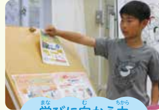
学びに向かう力 人間性など

「幼児期の終わりまでに育ってほしい姿」を目指して、 園と学校が一緒に協力します。 (「幼保小の架け橋プログラム」の実施)