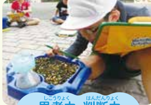
思考力・判断力 表現力など