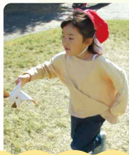
気付く・わかる やってみようとする