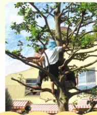
よりよい生活を 営もうとする