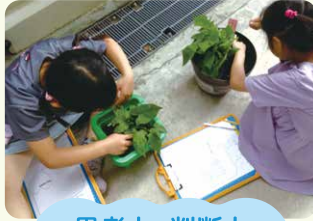
思考力・判断力 表現力など