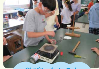
学びに向かう力 人間性など

「幼児期の終わりまでに育ってほしい姿」(10の姿)を手がかりに、園と学校双方の子どもの成長の様子や手立てなどについての相互理解や協働を目指します。(「幼保小の架け橋プログラム」の実施)