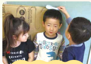
考える 試す・工夫する